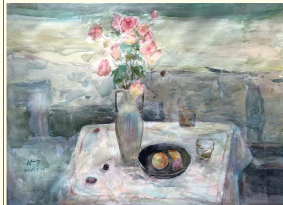
周婷《物生物语—暖》 指导教师: 苏雅拉其其格