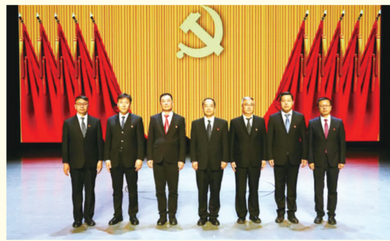
第二届纪律检查委员会委员 7人