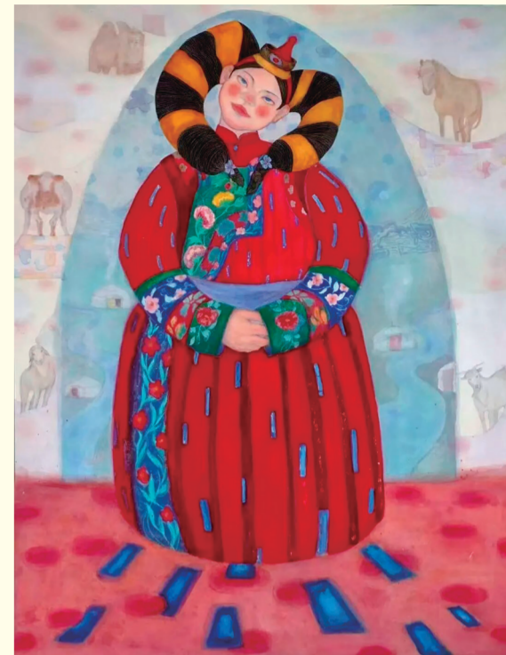
海日罕《草原暖阳》 指导教师: 云宇峰