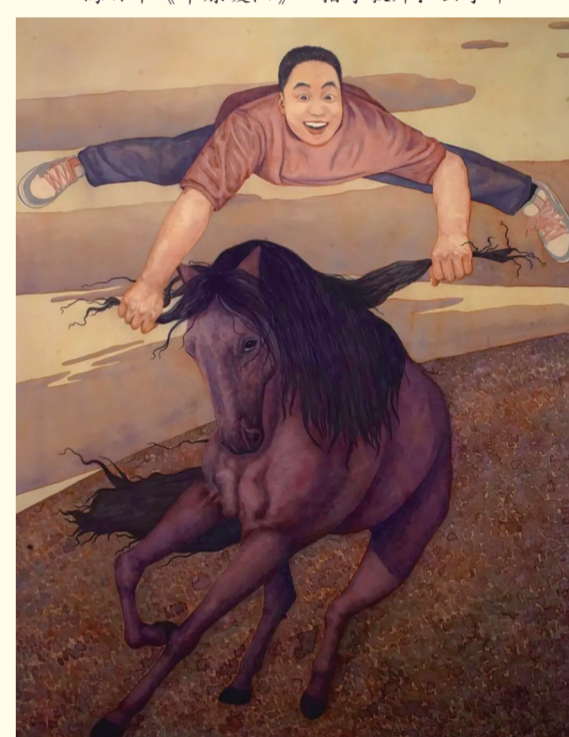
撤出拉胡《巴雅尔 No.2》 指导教师: 顿元芳