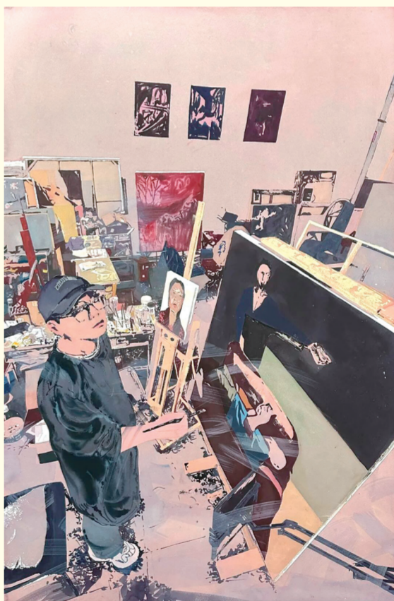
孙嘉《新青年》系列五 指导教师: 顿元芳