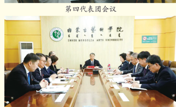
中国共产党内蒙古艺术学院第二届委员会第一次会议