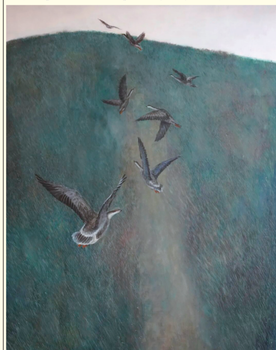
马啸《归途》 指导教师: 顿元芳