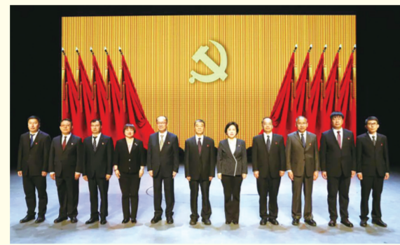
第二届委员会委员 11人