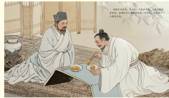
《廉政之本晏婴》(绘本节选) 创作者：于江 赵国辉 高弘 张天琪

我校将以此次获奖为契机，持续深化新时代校园廉洁文化建设，着力营造风清气朗、正气充盈的