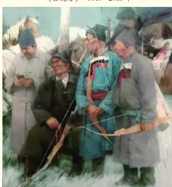
《草原老射手》油画 2019年