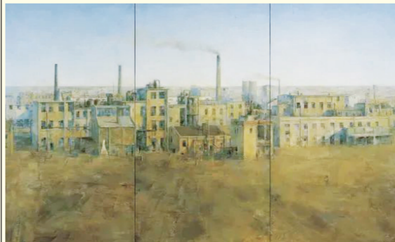
《西北老工厂》油画 2004年