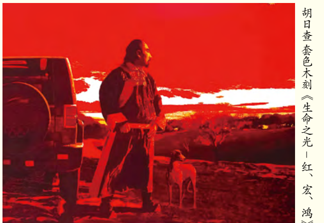
胡日查套色木刻《生命之光》红、宏、鸿