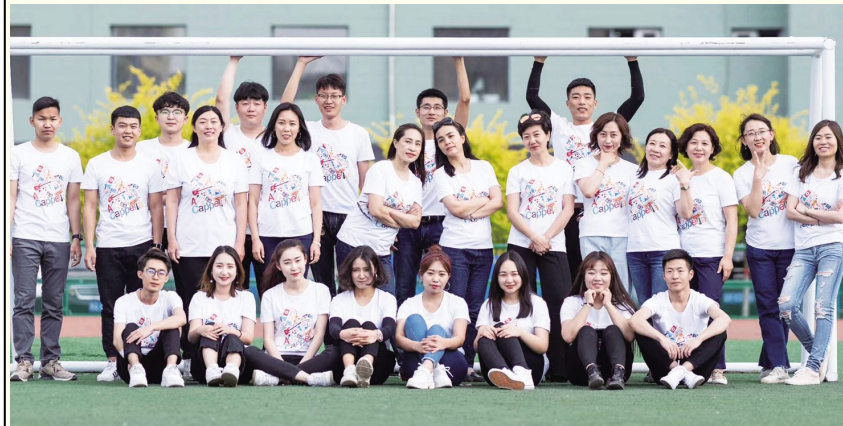
阿卡贝拉人声乐团师生合影

团队成员2017年11月被评为校级优秀教学团队,2018年3月荣获校级教学成果一等奖,2018年4月荣获自治区级教学成果一等奖。