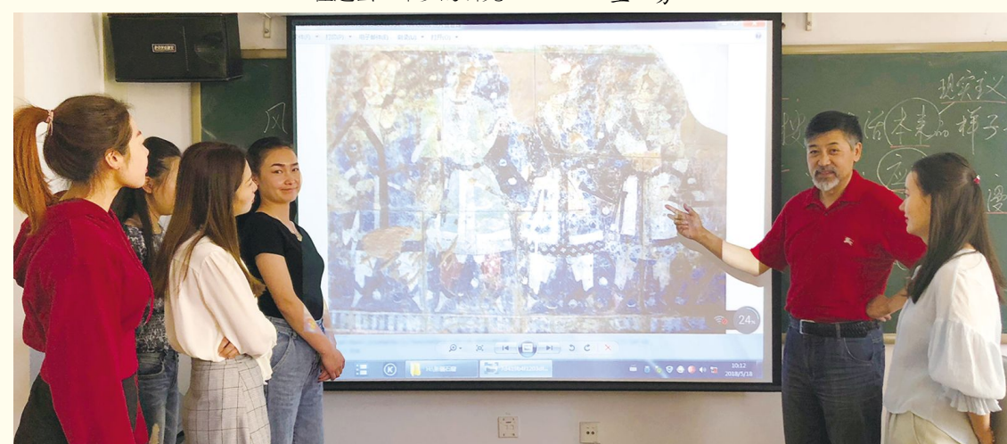
美术学院硕士学位点“北方少数民族美术研究方向”课堂