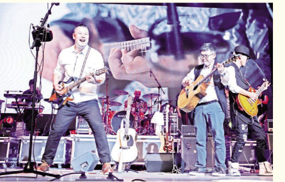
额尔古纳乐队演出现场