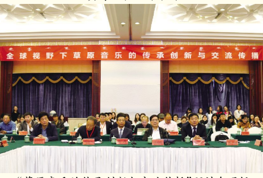
“草原音乐的传承创新与交流传播”研讨会现场