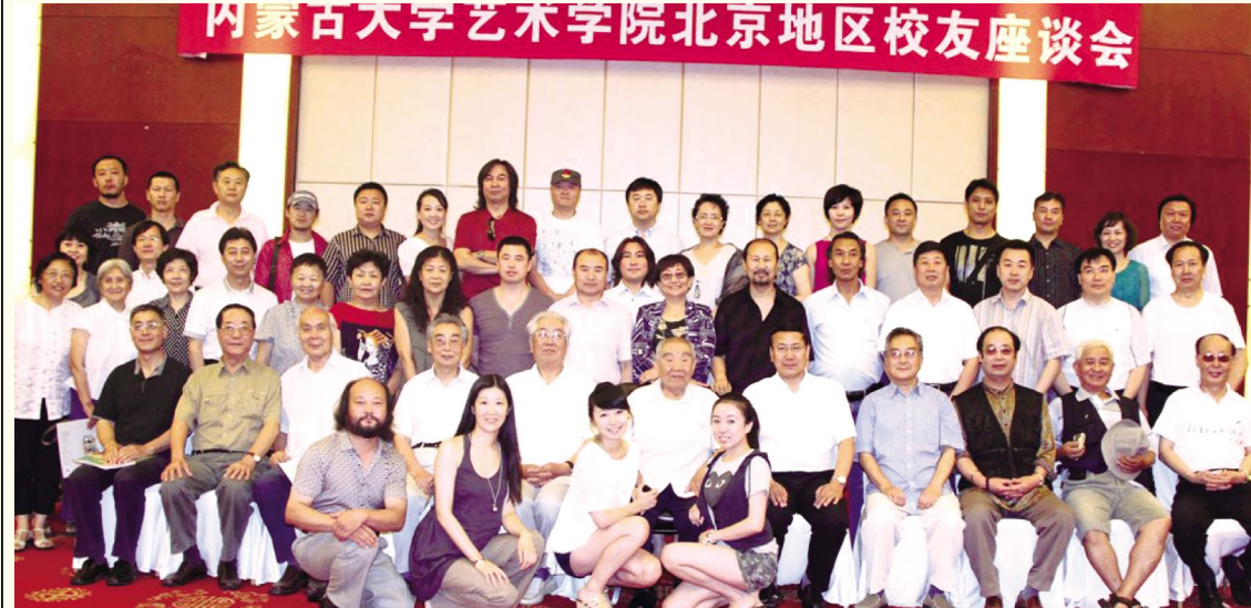
2011年北京校友会议后,布林同志与校友合影留念