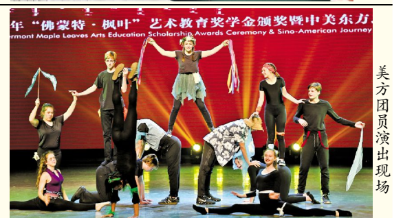
2018年“佛蒙特·枫叶”艺术教育奖学金颁奖暨中美东方之旅艺术交流演出