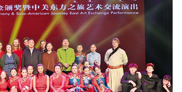
2018年“佛蒙特·枫叶”艺术教育奖学金颁奖暨中美东方之旅艺术交流演出