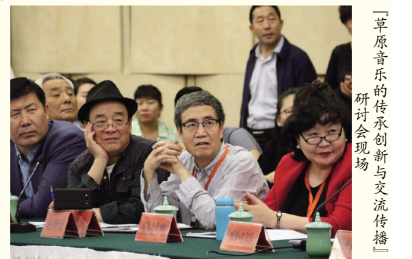
“草原音乐的传承创新与交流传播”研讨会现场

会上,研究了我校2018年思想政治工作要点及分工方案》并部署了2018年思想政治工作。赵海忠副书记对做好我校2018年思想政治工作提出了具体要求。(夏宇航)